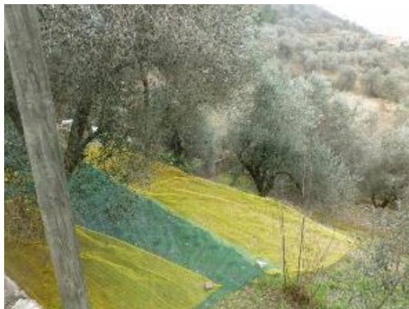
Les filets à olives

La traversée de Libre, (hameau français), offre la rencontre avec un vieux monsieur. Il nous rapporte que jadis, là où sont les oliviers, il y avait des vignes, et que chacun faisait son vin, et que à 13 heures plus d'un était déjà « bourré » ! Nous reprenons le sentier à la (b 416), grimpons une barre rocheuse avant de plonger vers la piste agricole de Praghio (b 106). A la ferme une pancarte indique que le fumier (de chèvres) est gratuit. Nous déplorons de n'avoir pas prévu de sacs !!