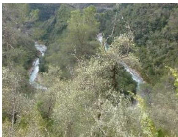
Les méandres de la Roya