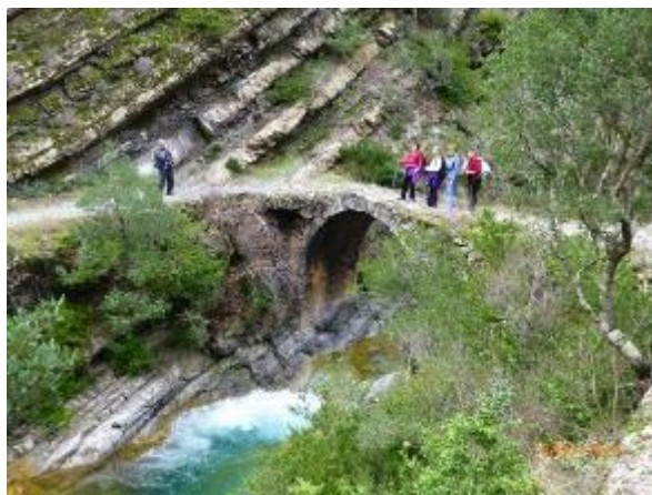
Le Pont Carleva